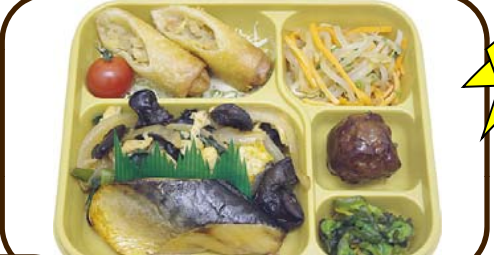
13 (月) サバ照焼と卵と野菜の中華炒め 熱量 903 kcal 蛋白質 27.0 g 脂質 31.1 g