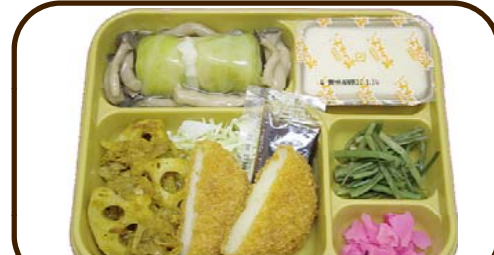
15 (水) クリームほたてコロッケと茶碗蒸し 熱量 740 kcal 蛋白質 18.5 g 脂質 26.4 g