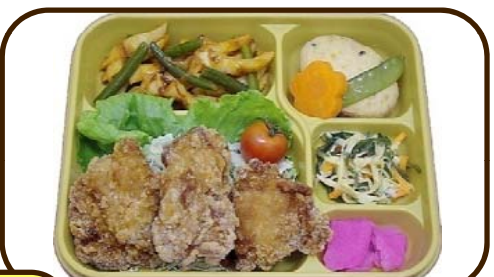
6 (月) 鶏竜田とちくわの中華炒め 熱量 899 kcal 蛋白質 23.8 g 脂質 29.2 g