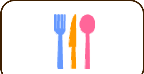
18 (土) お楽しみ弁当