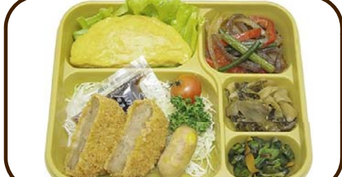
9 (木) マンチカツとチーズオムレツ 熱量 782 kcal 蛋白質 20.0 g 脂質 22.3 g