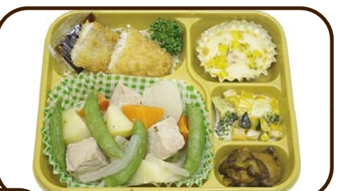
7 (火) 豚と大根のポトフとミニグラタン 熱量 784 kcal 蛋白質 25.4 g 脂質 21.7 g