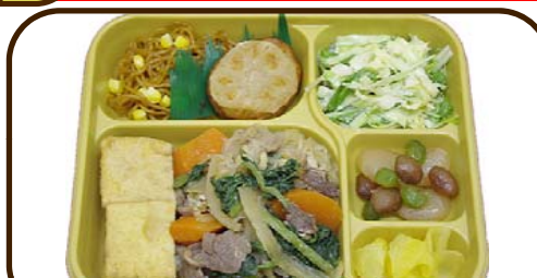
24 (金) 肉豆腐風煮と野菜のわさびマヨ和え 熱量 886 kcal 蛋白質 28.0 g 脂質 25.1 g