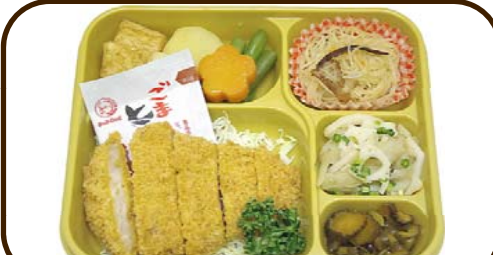
17 (金) ごまソースとんかつと焼ビーフン 熱量 783 kcal 蛋白質 18.5 g 脂質 15.4 g