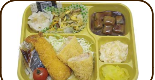
20 (月) 海老フライ&まぐろカツと味噌田楽 熱量 772 kcal 蛋白質 19.7 g 脂質 17.1 g