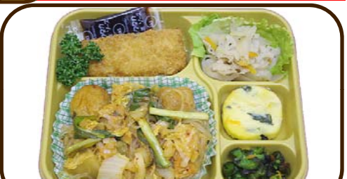
27 (月) 肉団子と大根のチゲ風煮とイカフライ 熱量 767 kcal 蛋白質 23.2 g 脂質 13.8 g