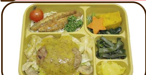
23 (木) ハニーマスタードバーグと磯わかめ 熱量 729 kcal 蛋白質 22.7 g 脂質 12.0 g