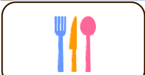
25 (土) お楽しみ弁当