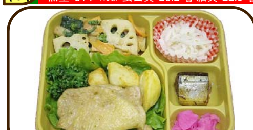
29 (水) 鶏の柚子胡椒オイル焼とサンマ生姜煮 熱量 832 kcal 蛋白質 23.2 g 脂質 26.9 g