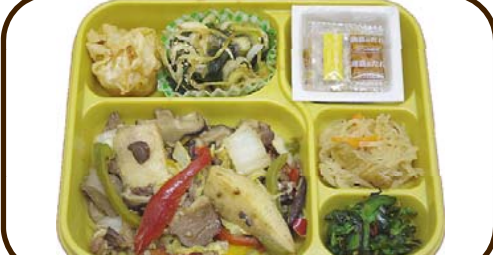
10 (金) 牛とキノコの韓国風炒めと揚げ焼売 熱量 792 kcal 蛋白質 25.5 g 脂質 19.4 g