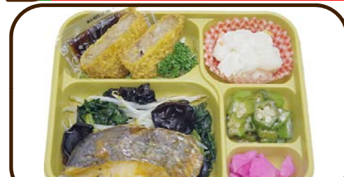
22 (水) ホキのチリ焼とオクラの中華和え 熱量 814 kcal 蛋白質 28.2 g 脂質 22.0 g