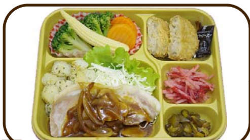
2 (木) 豚肉のデミソースがけとフリ中落ちカツ 熱量 794 kcal 蛋白質 22.9 g 脂質 20.2 g