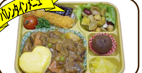
14 (火) ハヤシチューとハートオムレツ 熱量 872 kcal 蛋白質 25.4 g 脂質 22.3 g