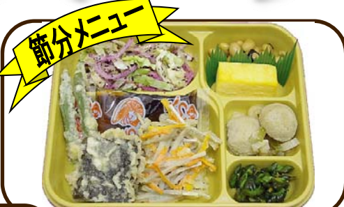
3 (金) ナス肉詰天&かき揚げと福豆 熱量 852 kcal 蛋白質 24.7 g 脂質 20.4 g