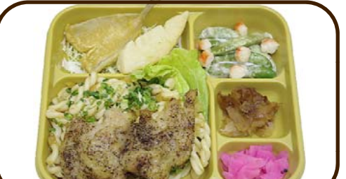
21 (火) グリルチキンと鱈と竹の子の唐揚げ 熱量 812 kcal 蛋白質 23.5 g 脂質 18.6 g