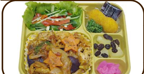
16 (木) 鶏と野菜のトマト炒めとイタリアンサラダ 熱量 856 kcal 蛋白質 24.2 g 脂質 29.1 g