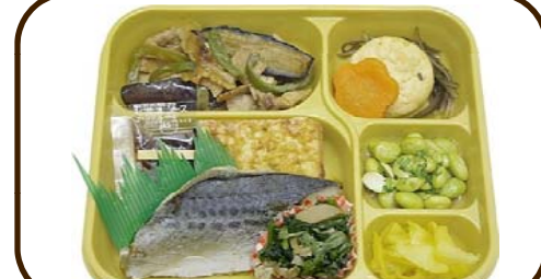
8 (水) サワラ西京焼と枝豆の梅和え 熱量 786 kcal 蛋白質 27.7 g 脂質 20.1 g