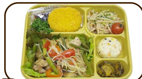
1 (水) 鶏と野菜の塩レモン炒めとコロッケ 熱量 822 kcal 蛋白質 22.7 g 脂質 25.1 g