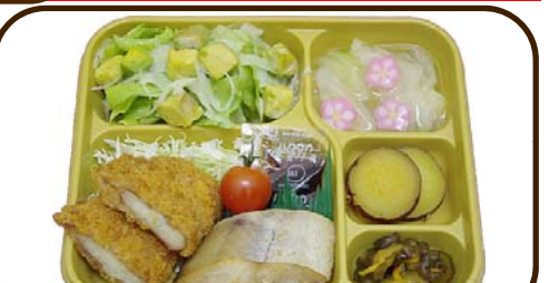
28 (火) タラ味噌焼とアボカドサラダ 熱量 732 kcal 蛋白質 19.3 g 脂質 14.0 g